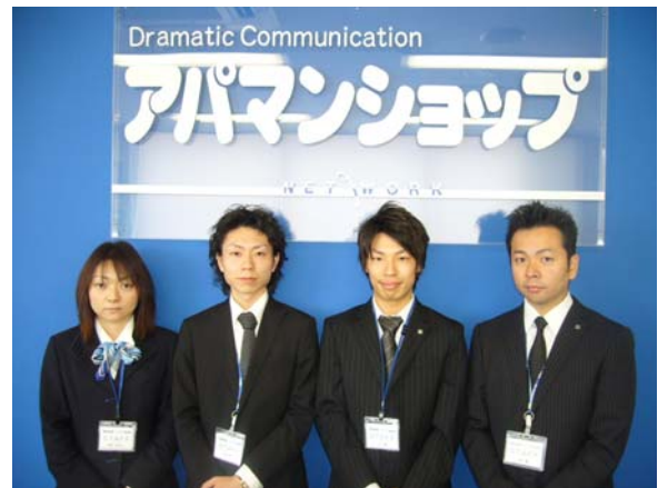
皆様のご来店心よりお待ちしております！ 藤江店 スタッフ一同